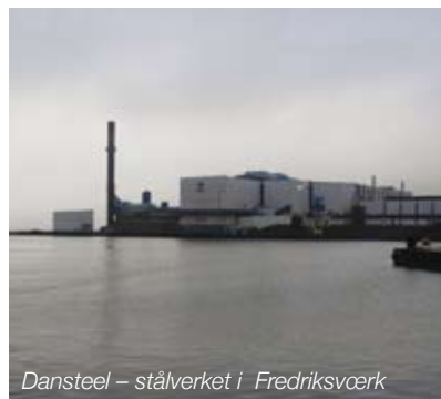
Dansteel – stålverket i Fredriksvørk