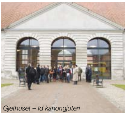
Gjethuset – fd kanongjuteri