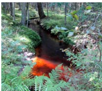
Av en bred isälv blev det en liten å – vattenet är rött av lösta järnoxider, som avlagras i krökarna till rödjord. Röda Jorden!