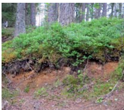
Typiskt tunt humuslager. Riddarhyttan.