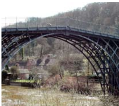
Den berömda gjutjärnsbron från 1779