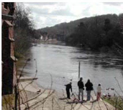
Bron knappt synlig längst bort.