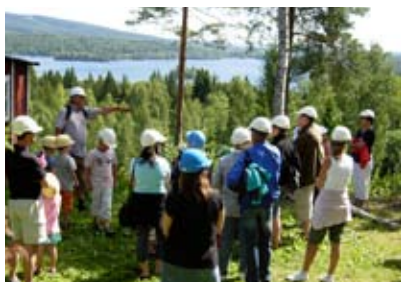
Flogbergets gruva i Smedjebacken. En av många välbesökta visningar för barn med föräldrar, som genomförs sommartid.