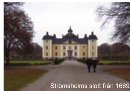
Strömsholms slott från 1669