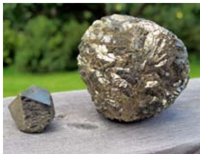
Pyrit (svavelkis), FeS 2 – järn och svavel i förening kan kristallisera så här vackert!