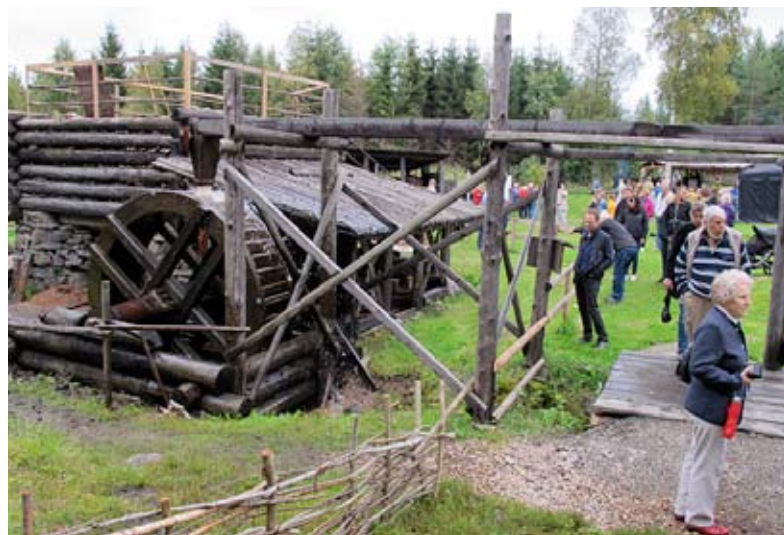
Pågående järnförsök fram till 15 september.