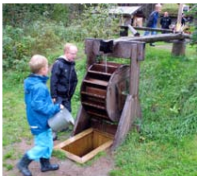
Barnaktiviter i "Barnens Bergslag"

Namnbytet kom dock överraskande plötsligt för Ekomuseum. Nya Lapphyttan är inarbetat, finns i guideböcker, foldrar och på skyltar. Det gamla namnet lär därför få leva kvar ett tag.