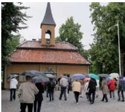
Samling framför Sigtuna rådhus, det minsta i Sverige. Det invigdes 1744 och byggnadsminnesförklarades 1971.