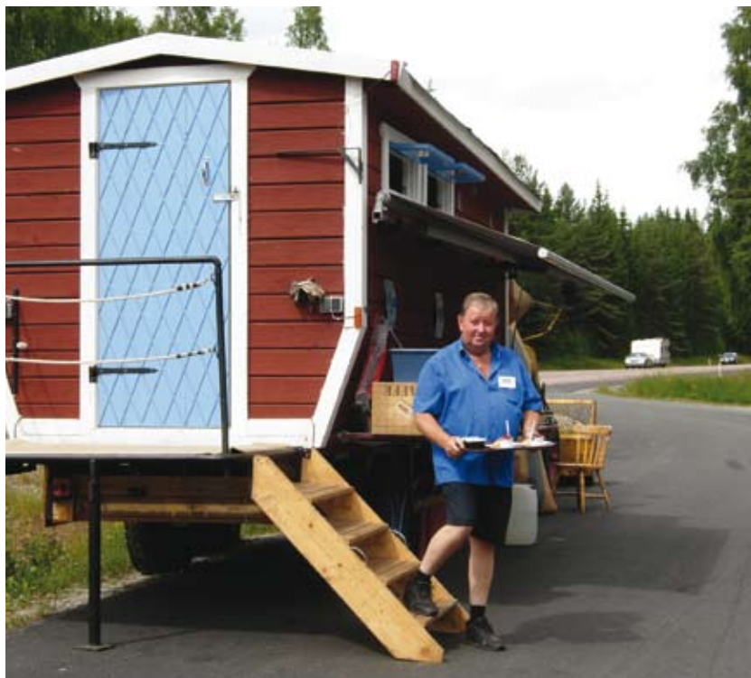
En fantasifull servicevagn får bilförare att bromsa in vid rastplats Dalaporten och ta en paus. Här finns både mat och fika samt information om trakten.