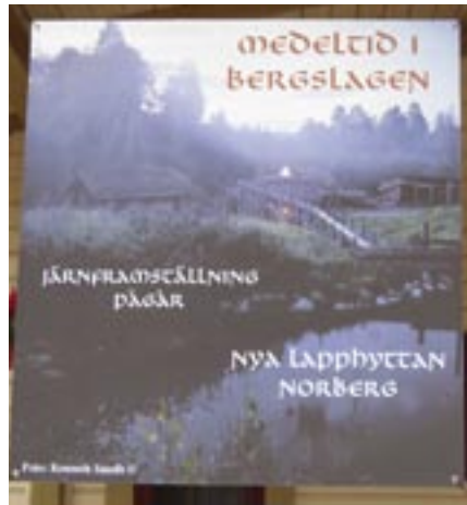
Nya Lapphyttan med den rekonstruerade medeltida masugnen.

Envisa masmästare och arkeologer arbetar sida vid sida med hjälp av frivillig arbetskraft för att hålla masugnen igång den tid som krävs för en järnsmälta. Det är ca två veckor när det är som mest in-