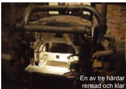
En av tre härdar rensad och klar