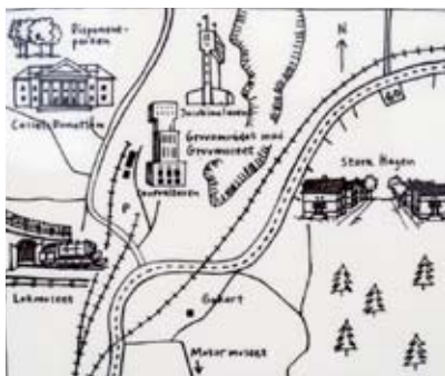
Tydlig liten karta över Grängesberg finns på Mojsen, som ligger precis i mitten t vå om centrallaven. Bostadsområdet Stora Hagen ligger vid Grängesbergs centrum.