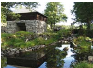
Husbyringen: Silfhytteå ödebruk med masugn från 1787 tillhörande Stjärnsunds bruk.