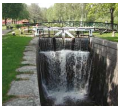
Kanalen vid Skantzen i Hallstahammar